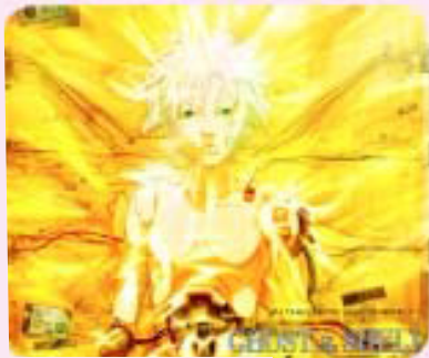
Ghost in the shell 2: Innocence