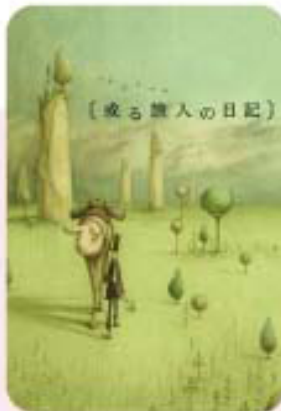
The Diary of Tortov Rodde